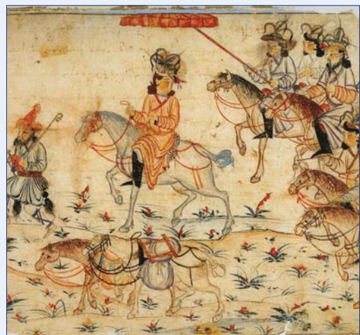
שליט מונגולי רוכב כשמעליו הסוכך המלכותי, איראן, המאה הארבע-עשרה