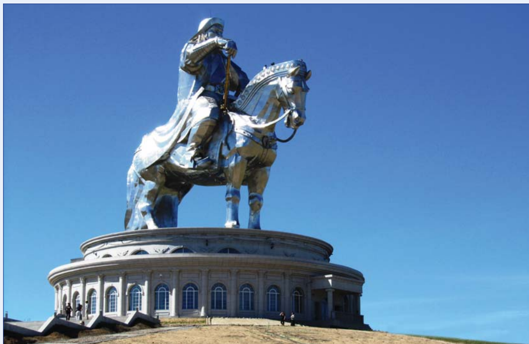
פסלו של צ'נגיס ח'אן משקיף על נהר היתולו במונגוליה, ממזרח לבירה אולך באטאר.

תרבות חומרית, בעיקר אמנות, עברה גם היא בקלות יחסית והותאמה לצרכים מקומיים: ההשפעה הסינית על הציור הפרסי היא אחת המורשות הידועות של התקופה המונגולית, שהותירה חותמה גם על אירופה, והיא בולטת בעיצוב הנוף. השאה־נאמה, "ספר המלכים", האפוס של איראן הפרה־אסלאמית שחובר במאה העשירית, אומץ בהתלהבות בידי המונגולים, ובאירוי המלכים הפרסים לבושים בלבוש מונגולי ומוקפים בנוף בעל מאפיינים סיניים. יתרה מזו, בהשפעת מודלים בודהיסטיים וביזנטיים וכחלק ממאמץ ההמרה של המונגולים לאסלאם, רווחים בתקופה המונגולית – לראשונה בתולדות אמנות האסלאם – ציורים מפורטים של הנביא מחמד ואירועים מחייו. הציור פרח גם בסין בשלטון המונגולים, אם כי ההשפעה מבחוץ הייתה פחותה. המונגולים אהבו תמונות ונתנו חופש פעולה לאמנים, שחלקם ניצלוהו כדי לבקר את המונגולים: כך למשל הבמבוק –